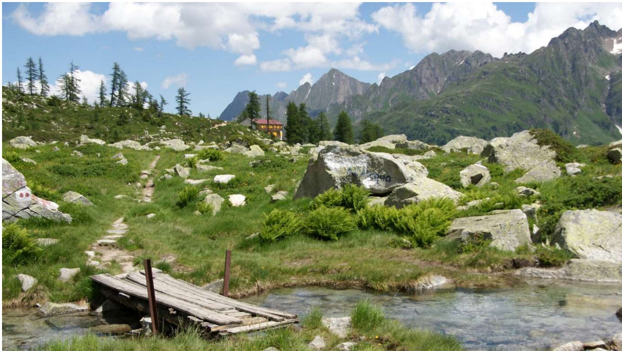
Quellgebiet des Ticino